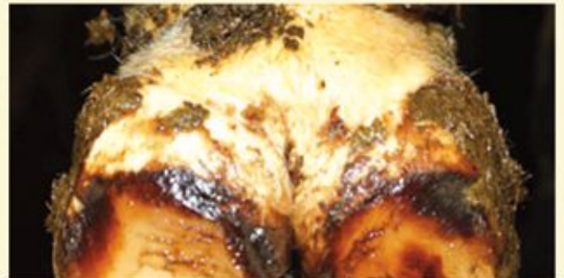
Selbe Klaue in der Klauenpflege nach Installation des KuhP-Fußbades

Auswertung der Klauenpflege vom 18.09.2017 und dem Pflegetermin vom 09.03.2018 (Die Installation des KuhP-Fußbades erfolgte Anfang Oktober 2017)